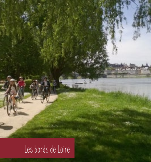
Les bords de Loire