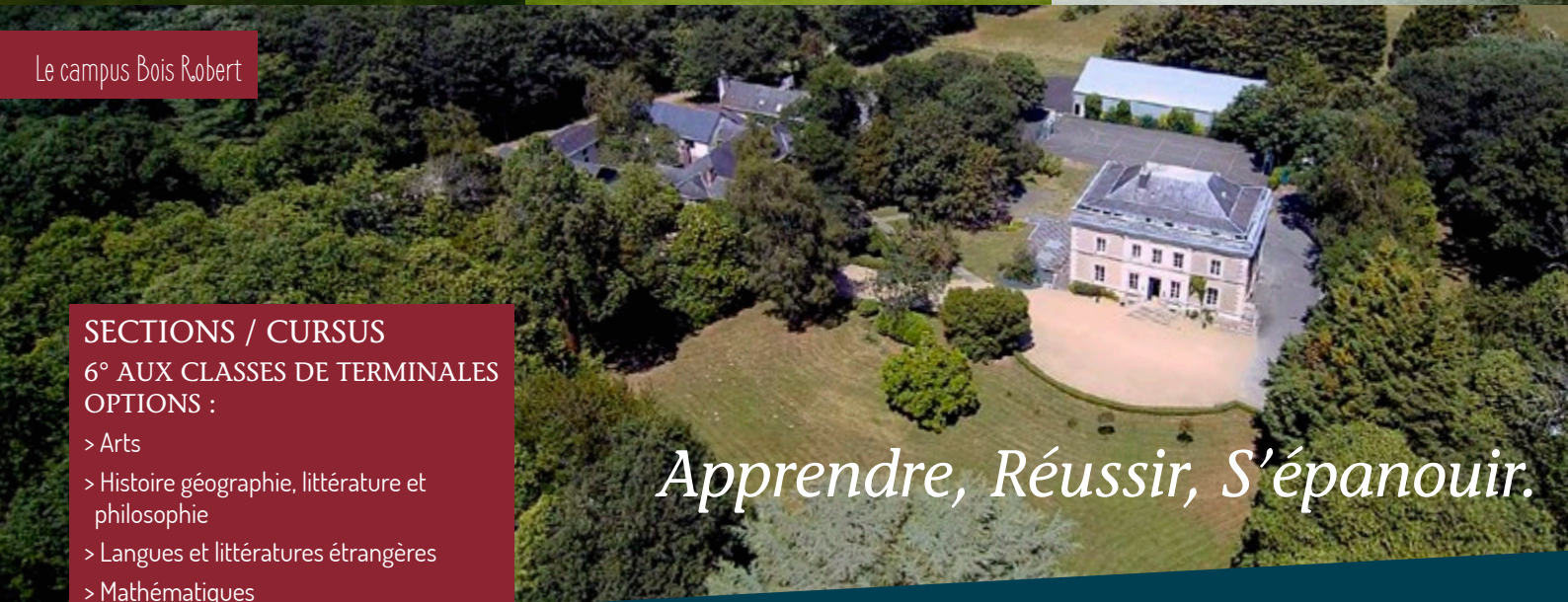
Le campus Bois Robert