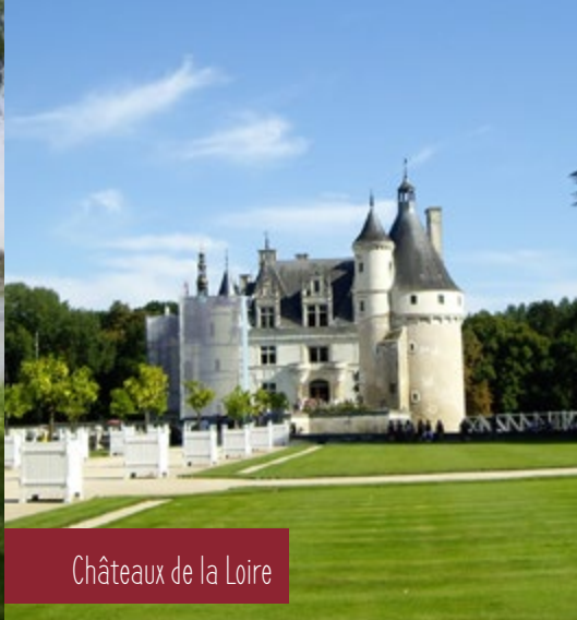
Châteaux de la Loire