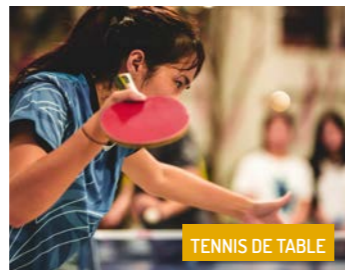
TENNIS DE TABLE