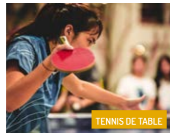
TENNIS DE TABLE